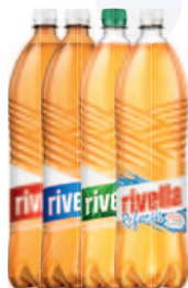
Rivella Rot, Blau, Grün & Refresh 6 x 150 cl