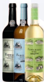
Fabelhaft Dirk Niepoort rot, weiss & Riesling 75 cl